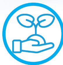
UMWELTSCHUTZ & NACHHALTIGKEIT